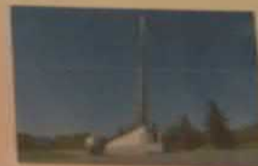
«Начало космического пути», Энгельсовый район