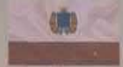
Флаг Саратовской области