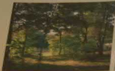
Природный парк «Кумысная поляна», г. Саратов

Рассмотри фотографии уникальных мест Саратовской области. Закрась красным цветом круги под фотографиями знакомых тебе мест, а зелёным – круги под фотографиями мест, в которых ты хочешь побывать.