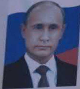
Президент Российской Федерации Владимир Владимирович Путин