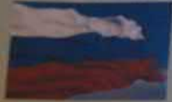
Флаг Российской Федерации