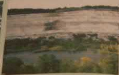
Маршрут «Тайны мелового карьера», Вольский район