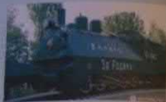
Парк Победы, г. Саратов