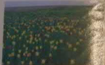
Тюльпанные степи, Новоузенский район