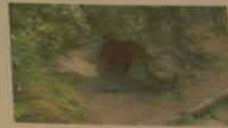
«Тропаю Кудяра», Новобурасский район