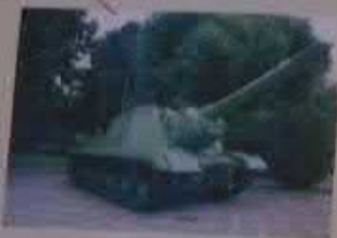
Саратовский областной музей краеведения