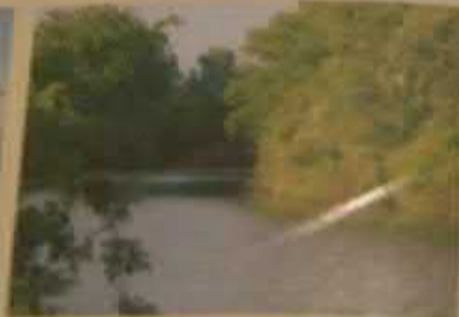
Дьяковский лес, Краснокутский район