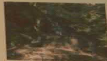
Водопады реки Еланки, Красноармейский район