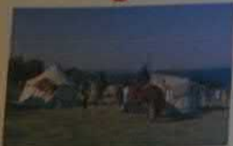
Фестиваль «Ужек. Один день из жизни средневекового города»