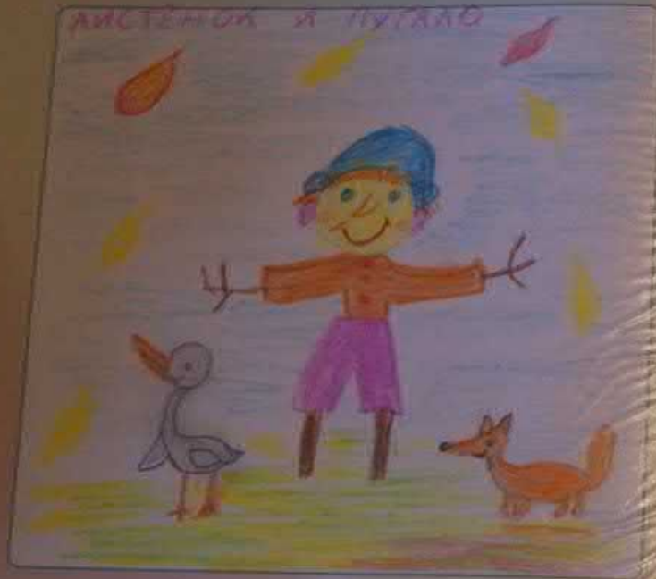
Саратовский театр кукол «Теремок»