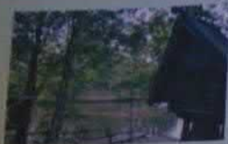
Городской парк, г. Саратов