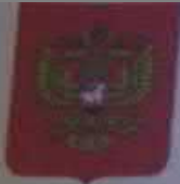
Герб Российской Федерации