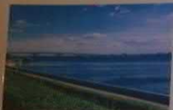
Набережная космонавтов, г. Саратов