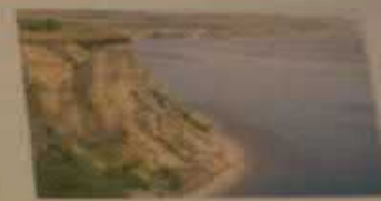
Утёс Степана Разина, Красноармейский район