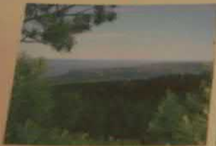
Национальный парк «Хвалынский», Хвалынский район