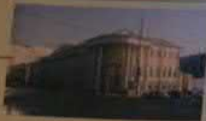
Саратовский художественный музей А.Н. Радищева

Посмотри внимательно, не ошибся ли фотограф, когда подписывал названия музеев на фотографиях. Если ты сомневался, спроси у родных.