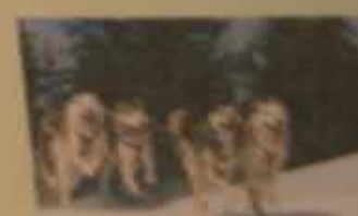
Догтрекинг «8 гостей к тебе», Саратовский район