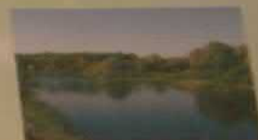
Сквер Рассказань, Балашовский район